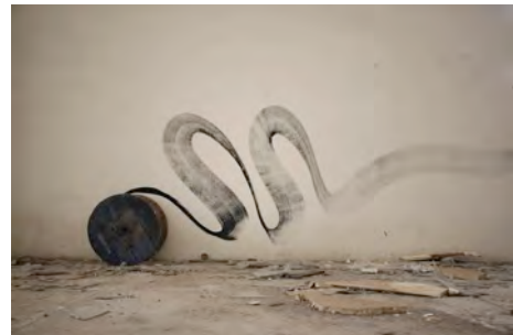
Espace abandonné, encre, Athènes, 2016

Avec une grande force graphique entre design et peinture, entre aplats monochromatiques et signes d'alphabet illisibles, l'artiste inscrit ses œuvres telles des traces éphémères en milieu urbain souvent désaffecté.