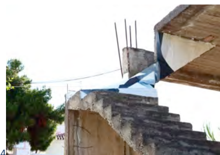
Dépaysages , acrylique sur papier de riz Spetses, 2014