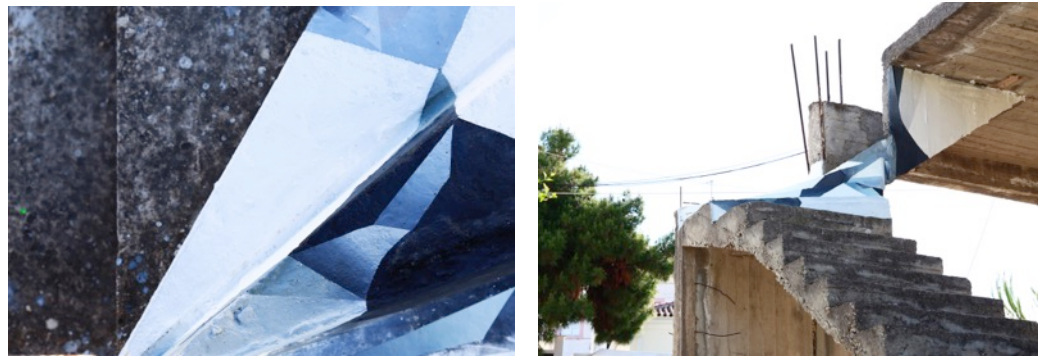
Dépaysages, acrylique sur papier de riz Spetses, 2017