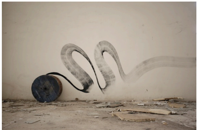
Εγκαταλελειμένο εργοστάσιο Αθήνα, 2016

Με μία ιδιαίτερα δυνατή χειρονομία γραφής, μεταξύ σχεδίου και ζωγραφικής, μεταξύ μονοχρωματικής επιφάνειας και σημάδια ακατανόητου αλφαβήτου, ο καλλιτέχνης εγγράφει τα έργα του σαν εφήμερα ίχνη σε δημόσιους αστικούς ή βιομηχανικούς εγκαταλελειμένους χώρους.