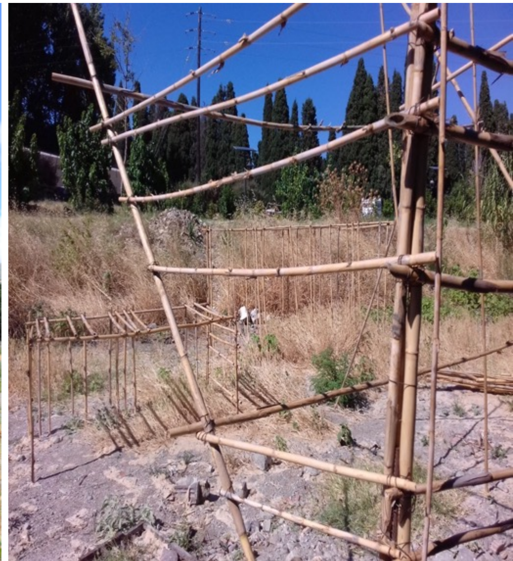
Χωρίς τίτλο. Καλάμια, σύρμα. Sans titre. Cannes, fil de fer.