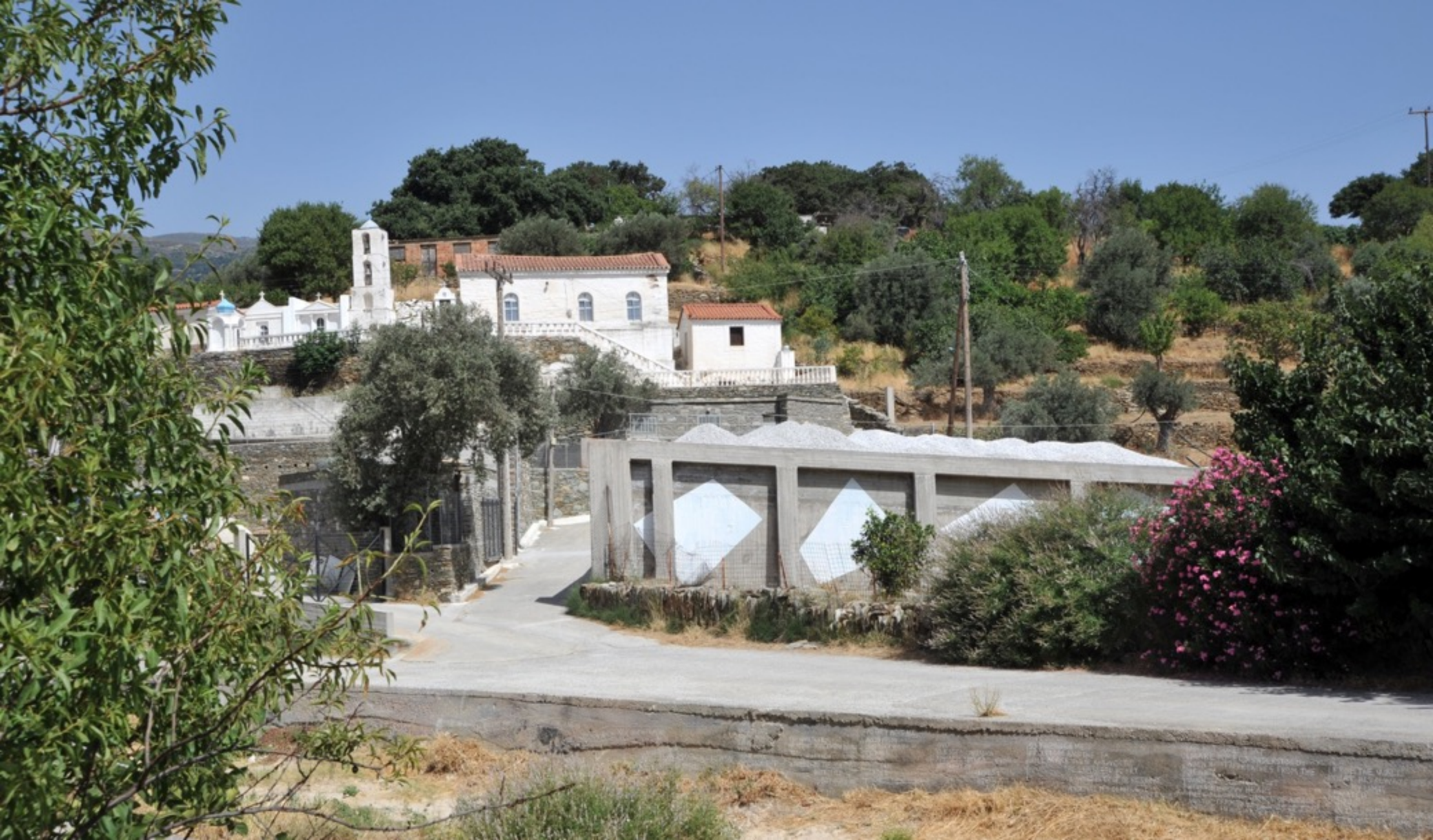
Outer space XIII. Ασβέστης. Outer space XIII. Chaux grasse.