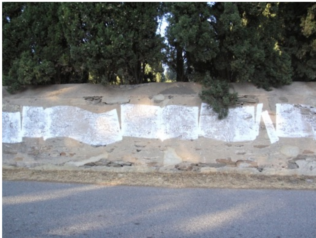
Χωρίς τίτλο. Ασβέστης Sans titre. Chaux grasse