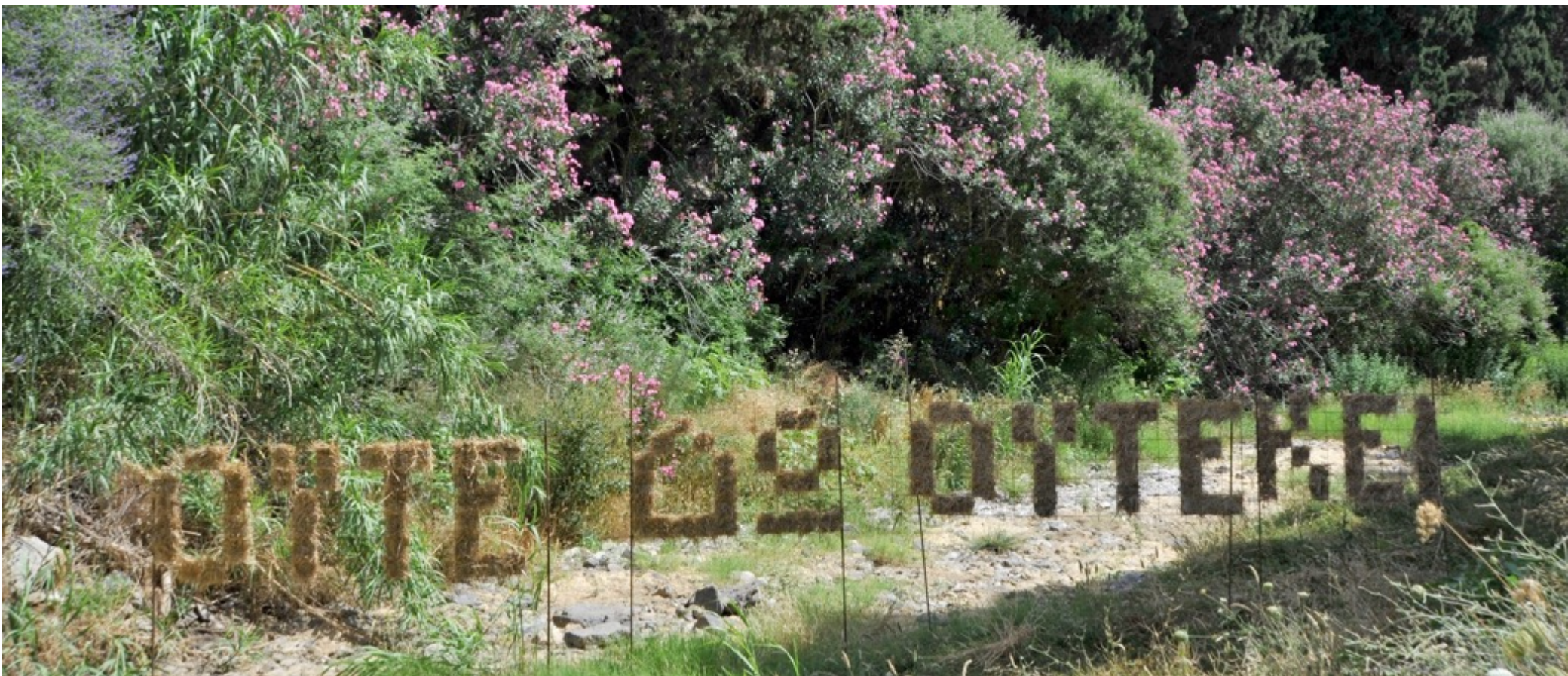
Ούτε δω, ούτε κει. Άχυρο, οικοδομικό πλέγμα, σιδερόβεργες. Ni ici, ni là-bas. Foin, grillage de construction, barres métalliques.