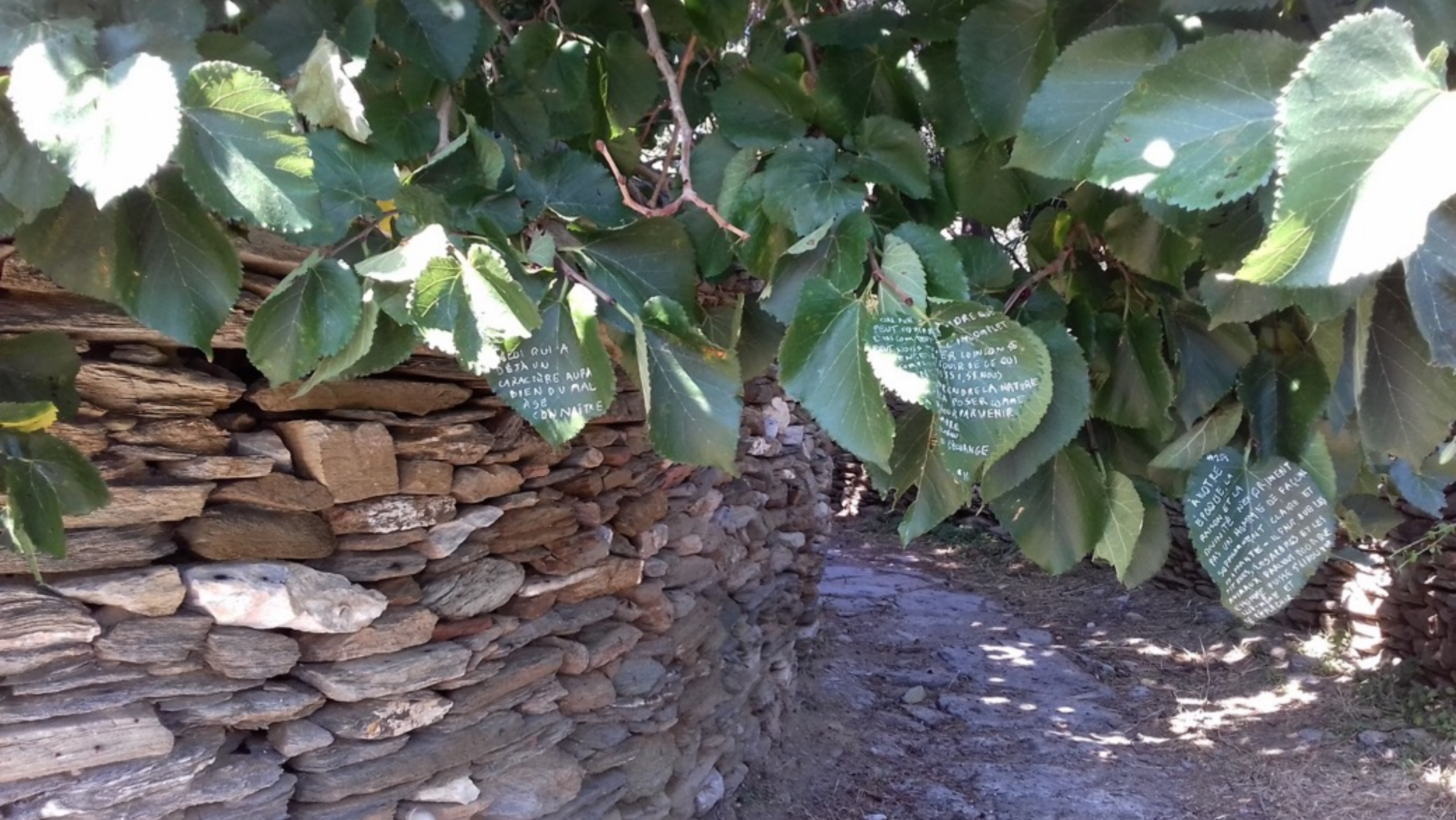
Το ΕΠΙΤΟΠΟΥ εγγράφεται στα πολιτιστικά δρώμενα του πολιτιστικού συλλόγου ΕΠΙΤΟΠΟΥ με έδρα τα Λειβάδια Άνδρου ΕΠΙΤΟΠΟΥ s' inscrit dans les actions culturelles d'ΕΠΙΤΟΠΟΥ association culturelle, Livadia, Andros